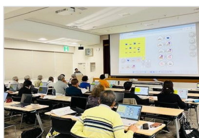
モグラの絵を描く